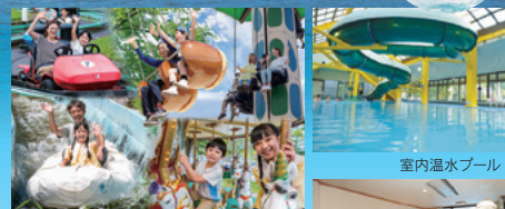
池の平ファミリーランド

※1泊2食(税込)お一人様料金・2名様以上でお申込ください。 ※2名様1ルームはお1人様2,200円税込アップ ※入湯税150円(大人料金のみ対象)別途必要となります。