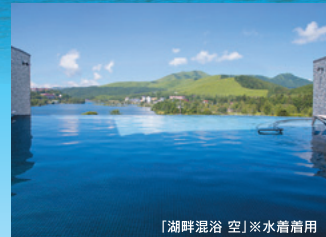
「湖畔混浴 空」※水着着用

※小学生(大人料金の70%) 3歳から小学生未満(大人料金の50%) 3歳から小学生未満4,400円税込(食事あり・寝具なし・特典なし) 0～2歳無料(食事・寝具なし) ※お部屋のタイプは洋室又は和洋室となります。 ※夕食・朝食共にレストランにて、ビュッフェのお食事となります。 ※ファミリーランド営業4/20～11/17